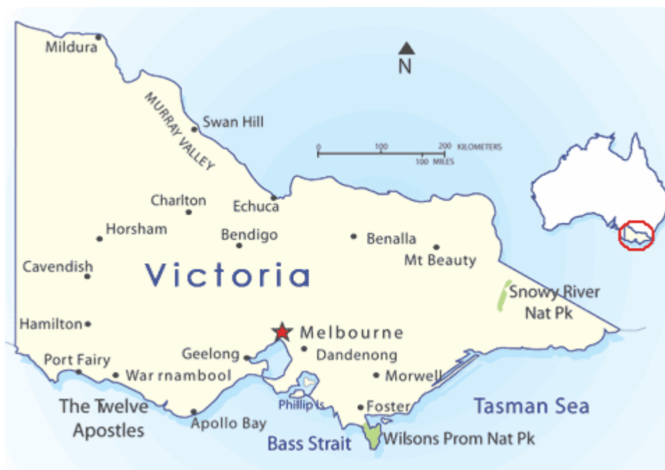
Victoria rất nhỏ so với các Tiểu bang khác

Melbourne là thủ phủ (capital) của tiểu bang Victoria. Mặc dù dân số tiểu bang Victoria đứng hàng thứ nhì sau New South Wales, nhưng Victoria là tiểu bang nhỏ nhất trên đất liền của Úc. Victoria có diện tích 237,629 km 2 (91,749 sq mi) và dân số khoảng 5 triệu rưỡi, nên đã trở thành tiểu bang có mật độ dân cư cao nhất (không kể lãnh thổ ACT hay thủ đô Canberra). Trước khi giới thiệu Melbourne, xin vài hàng nói về tiểu bang Victoria: