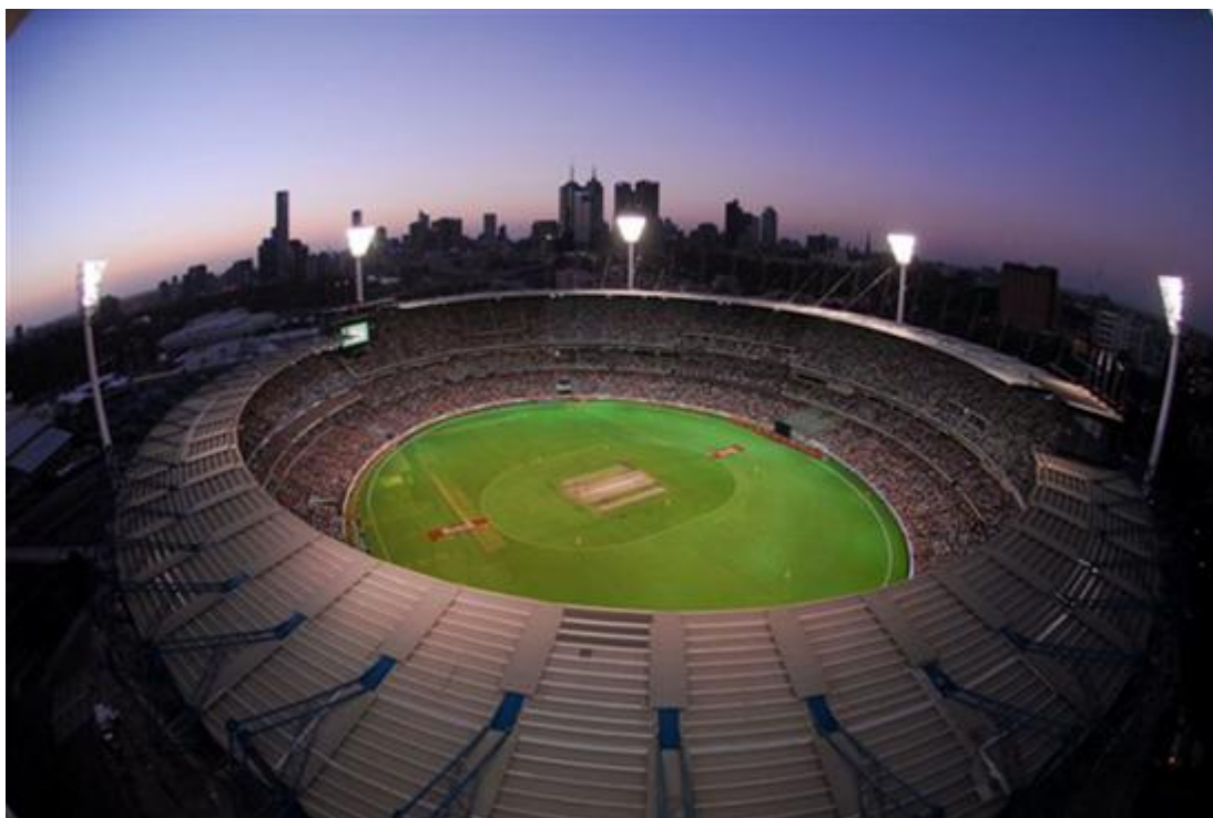
Melbourne Cricket Ground

Dân Victoria được coi là dân "mad" về thể thao nhất là bộ môn "football" mà hầu như ngoài Úc chẳng có nước nào chơi (nên thường gọi là Ausie Rule). Bảng "A" bộ môn này có 16 đội mà riêng Victoria đã có 10 đội. 6 đội còn lại ở các tiểu bang khác đều có nguồn gốc từ Victoria. Sân MCG (Melbourne Cricket Ground) với trên 100 ngàn chỗ ngồi là trung tâm của môn "football" này. Dân Victoria rất sợ một ngày nào đó phải dời trận chung kết qua nơi khác, khi không có đội nào của Victoria được tranh đấu. Bộ môn bóng tròn (soccer) hiện đang phát triển ở Úc nói chung và Victoria nói riêng. Số học sinh trung, tiểu học tham gia chơi soccer hiện đã hơn hẳn các môn thể thao khác.